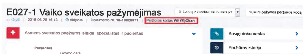
3 paveikslas. Sugeneruotas peržiūros kodas

Sistema sugeneruoja naują pažymos peržiūros e. sveikatos portale kodą, kuris parodomas atnaujintame medicininės pažymos peržiūros lange.