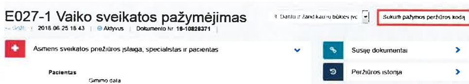
1 paveikslas. Sukurti pažymos peržiūros kodą