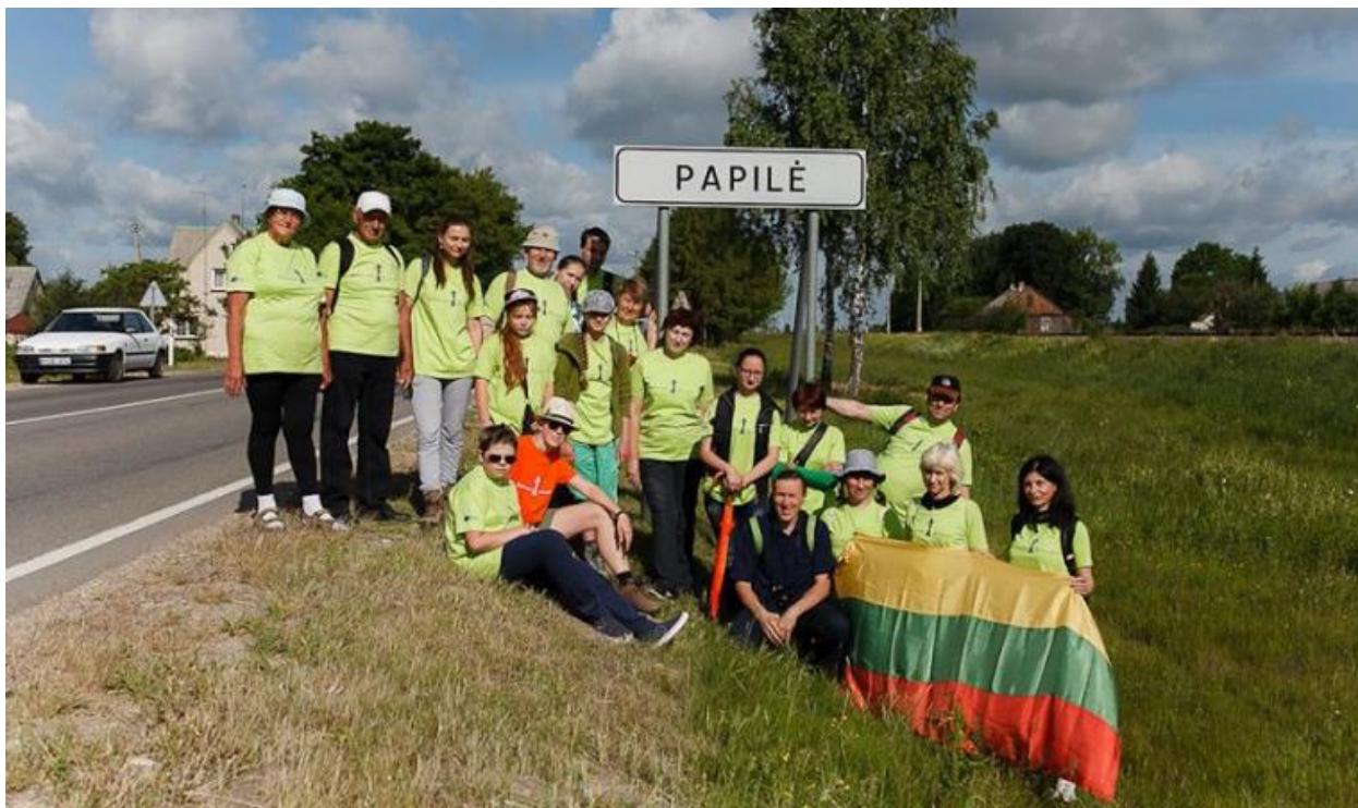
Nuotraukoje – žygeiviai didžiojo kelio pradžioje...